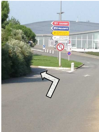
Direction P2 à gauche après le dernier rond point / Direction P2 left after the last roundabout