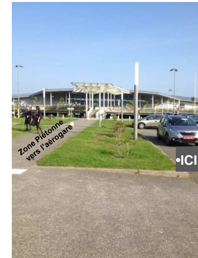
Emplacement de stationnement le long des pelouses centrales / Parking space along the central lawns