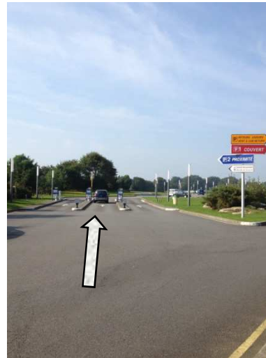
Entrée parking P2 sur la gauche / P2 car park entrance on left